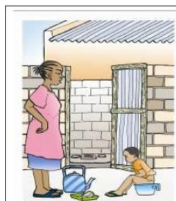
Enfant en train de déféquer dans un pot