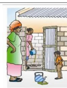
Femme qui jette les selles de l'enfant dans les latrines