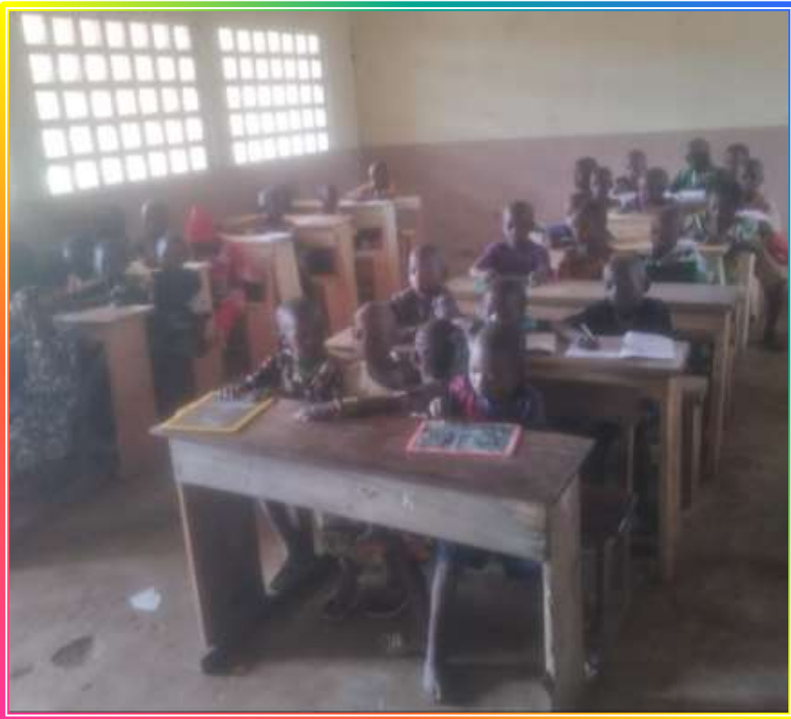
Le village a fait des bancs neufs pour cette classe

Les phrases en français sont destinées à la grande section